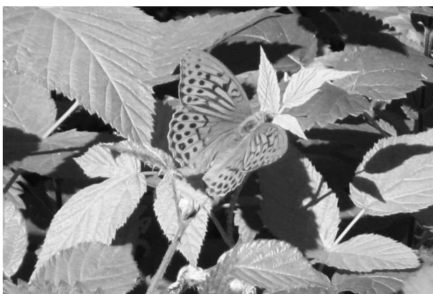
De keizersmantel is een zeer zeldzame dagvlinder waarvan er jaarlijks enkele zwervers worden gezien. Dat er in Wachtebeke blijkbaar een mini-populatie huist is dan ook heel bijzonder!

Op 3 juli 2011 was het een zomerse dag en